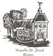
Kapelle St. Josef Eisten

Dienstag 16:00 – 18:00 Uhr bonifatius-hueven@web.de