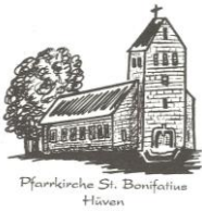
Pfarrkirche St. Bonifatius Hüven